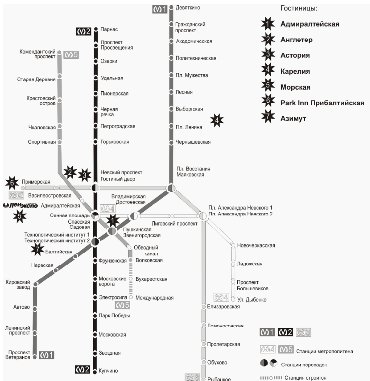
СХЕМА ЛИНИЙ САНКТ-ПЕТЕРБУРГСКОГО МЕТРОПОЛИТЕНА

Подать заявку и получить полную информацию Вы можете по телефону/факсу (812) 321 2678, 321 2610 info@lenexpotravel.ru • www.lenexpotravel.ru